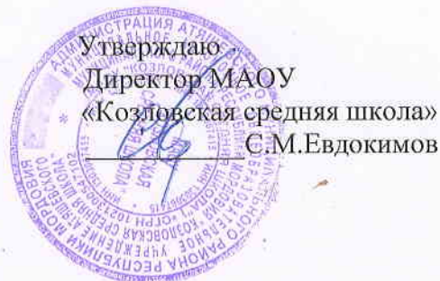
График посещения школьной столовой родительской комиссией по контролю за организацией и качеством питания на 2024-2025 учебный год.